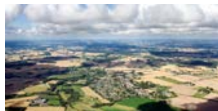
Udflugt 13: Klimaprojekter som driver for forbedring af landskabet (Plan22+)