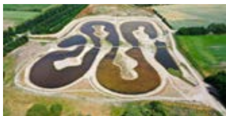
Udflugt 15: Genskabelse af vandløbet Evrenden - en forudsætning for byudvikling