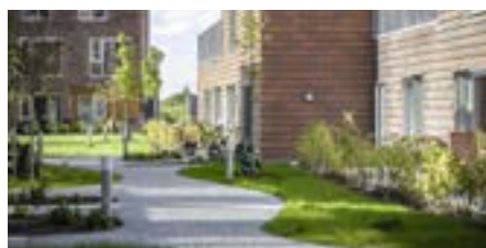
Udflugt 9: Grønne strategier i Vollsmoses transformation