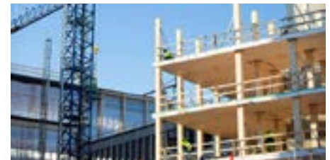
Udflugt 4: Nørrebroplanen - fra industri- kvarter til byens bindeled