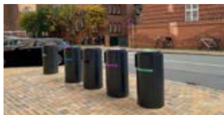
Udflugt 6: Affald og kvalitet i byrummet