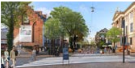
Udflugt 2: Grøn parkeringsstrategi – nye byrum

Udflugter foregår fredag den 4. oktober kl. 10.30-14.00. Alle udflugter starter og slutter i ODEON.