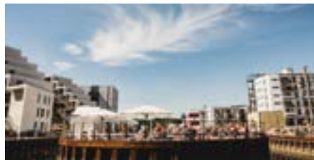
Udflugt 3: Odense indre havn – en ny central bydel