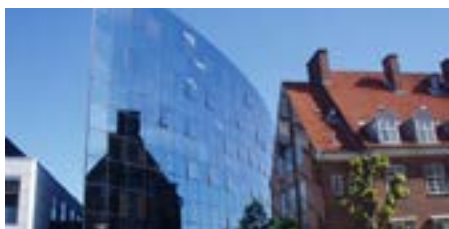
Udflugt 11: Transformation af Gl. OUH – klimapotentialer, dilemmaer og den langsigtede kvalitet