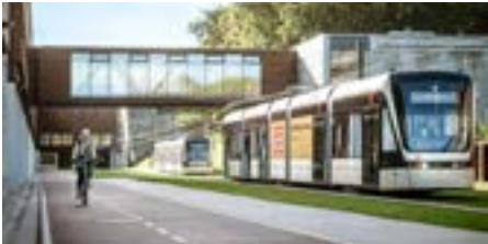
Udflugt 1: Letbanen som pulsåren i byfortætningen