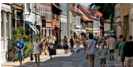
Udflugt 8: Mere liv i bymidten - at fortætte mennesker og oplevelser