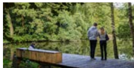
Udflugt 16: Ud i det blå langs Odense Å