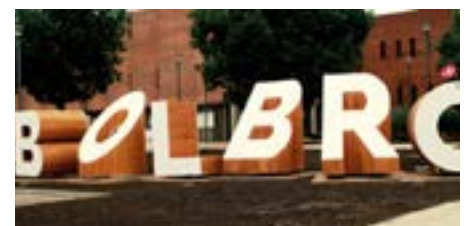
Udflugt 10: Bolbro – områdefornyelse med klimaintegrerede løsninger