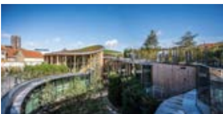
Udflugt 5: Fra gade til by – fra firsporet gade til bilfri bydel