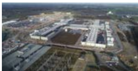
Udflugt 12: Erhvervslandskaberne i den grønne omstilling