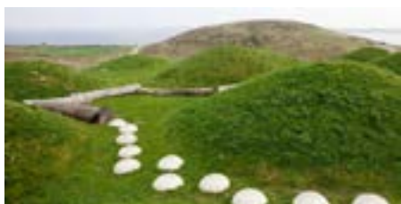
Udflugt 14: Odense ved fjorden: Landskabsforandringer med omtanke