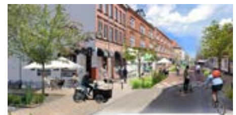
Udflugt 7: Grøn mobilitet i Skibhuskvarteret