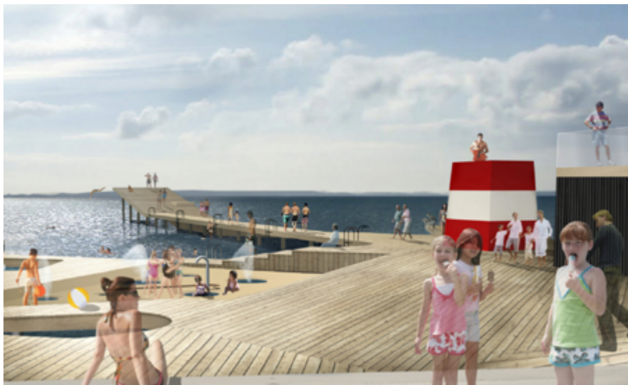
Illustration: JDS Arkitekter, Faaborg Havnebad.

Det kræver vedholdende og hårdt arbejde at realisere en strategi. Udvikling og forandring tager tid. Men til gengæld, hvis strategien er klar, stærk og overbevisende, som i Faaborg Kommune så bakkes den op af politikerne. En forudsætning for at visioner kan realiseres er netop denne opbakning, og især at politikerne står fast på beslutningerne - de vil udviklingen af bymidten -, selv om de møder modstand fra borgerne. Engagementet smitter af på eksterne developere, der ser Faaborgs udviklingspotentiale. Foruden politikernes engagement drives udviklingen i dag, i høj grad af nye kræfter (Byforum) Masterplanen ligger op til at understøtte Faaborgs frivillige kræfter og forventningen er, at det er denne energi, som vil fylde mere og mere i gadebilledet.